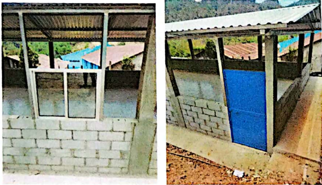
Foto 3: Mejoramiento de puertas y ventanas ya que no contamos con ellas en el centro educativo