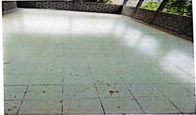
Foto 2: Mejoramiento de piso para una mejor atencion a los niños iscritos.