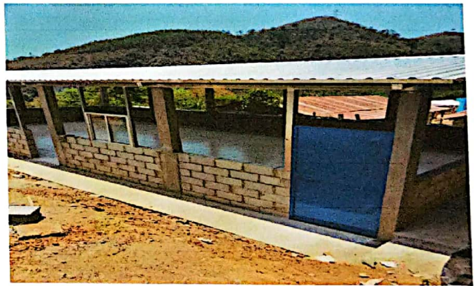
Foto 4: Mejoramiento de loza ya que los niños reciben clases en suelo de tierra

Observación: Si es necesario se pueden agregar hojas adicionales y actualizar el número de hojas.